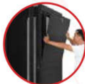
4 cửa hông cho trọng lượng nhẹ Sử dụng chung chìa cho 4 cánh