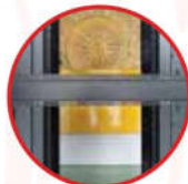
iFlex-Frame™ Kết nối đa điểm, dễ dàng điều chỉnh