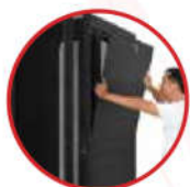
4 cửa hông cho trọng lượng nhẹ Sử dụng chung chìa cho 4 cánh