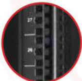
Thanh bắt thiết bị có khóa ID và được đánh số U rõ ràng