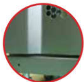
Tải trọng tối đa 4 chân đế: 1350 kg Tải trọng tối đa 4 bánh xe: 1000 kg