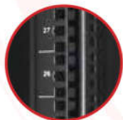
Thanh bắt thiết bị có khóa ID và được đánh số U rõ ràng