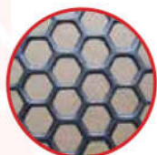
Cửa trước & sau đột lỗ lục giác thông thoáng 64%