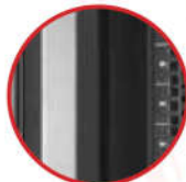
Xtruk™ khung 9 cạnh, chịu tải trọng 1.350kg