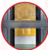
iFlex-Frame™ Kết nối đa điểm, dễ dàng điều chỉnh