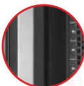
Xtruk™ khung 9 cạnh, chịu tải trọng 1.350kg