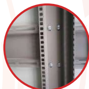
iFlex-Frame™ Kết nối đa điểm, dễ dàng điều chỉnh