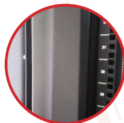
Xtruk™ khung 6 cạnh, chịu tải trọng 1.350kg