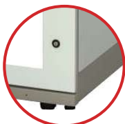
Tải trọng tối đa 4 chân đế: 1350 kg Tải trọng tối đa 4 bánh xe: 1000 kg