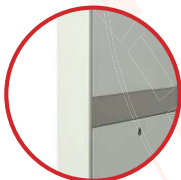
4 cửa hông cho trọng lượng nhẹ Sử dụng chung chia cho 4 cánh