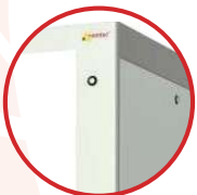
Cửa trước Mica cho phép nhìn thấy thiết bị bên trong