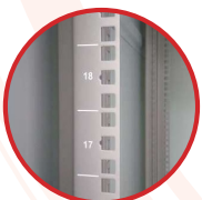
Thanh bắt thiết bị có khóa ID và được đánh số U rõ ràng